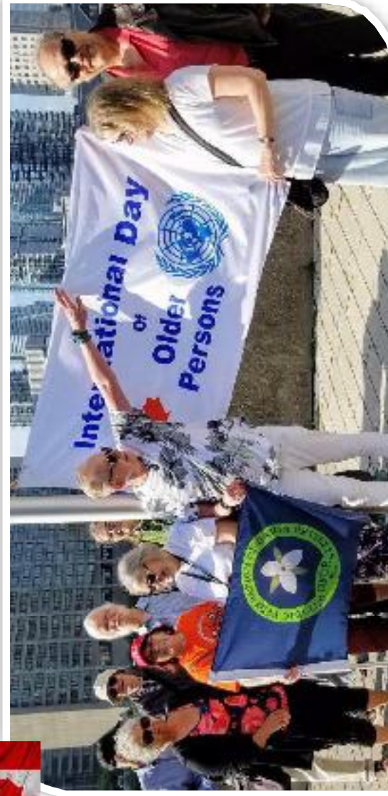
Union activists from the Ontario Federation of Union Retirees gather for the annual October 1st ceremony at Toronto's City Hall in Canada's largest city.