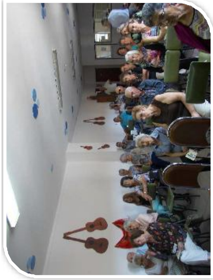
Marinha Grande, Portugal