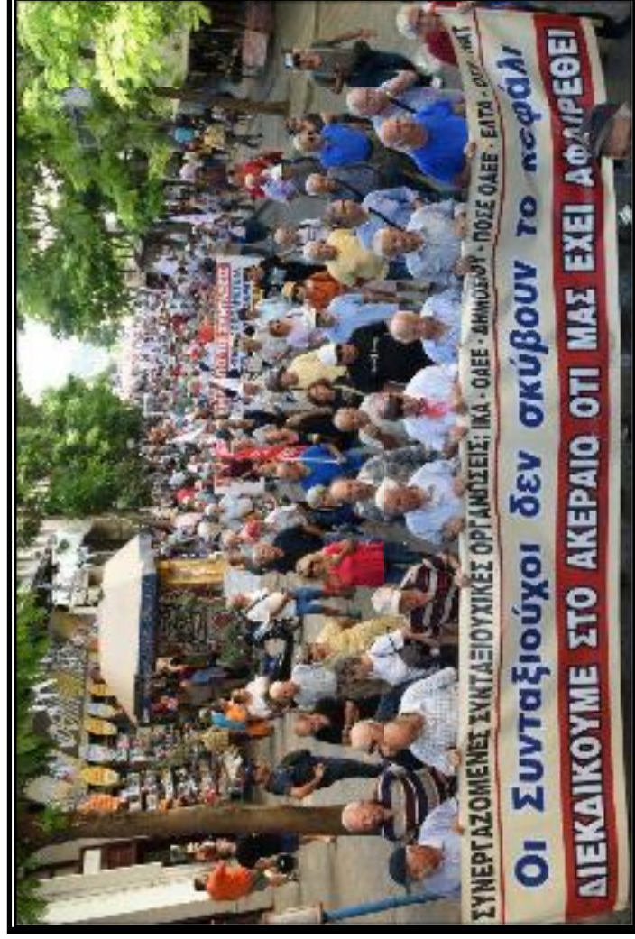
1 de octubre en Grecia