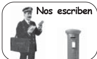
Nos informan sobre carta enviada