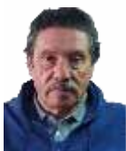
Por: Juan G. Salguero J. Afilado a la OCP

P or fin, luego de más de tres décadas, las víctimas de la UP y el mundo entero, pudieron ver sentado al Estado colombiano en el banquillo de la Corte Interamericana de Derechos Humanos, acusado por el exterminio de ese partido. Sucedió en la audiencia realizada a lo largo de cinco jornadas, del 8 al 10 de este febrero, durante las cuales, en forma virtual, se escucharon los desgarradores testimonios de algunos de los sobrevivientes, y de familiares de los más de 60000 asesinados, del delegado de la Comisión Interamericana de Derechos Humanos, de peritos, de organizaciones sociales afectadas y del Estado, entre otras.