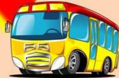
transporte de proximidad