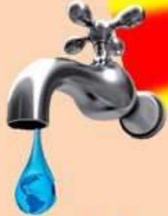
agua potable en ella