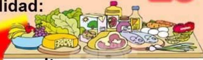
alimentos sanos y suficientes